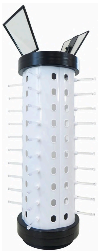
Ekspozytor z lusterkami na ladę - pojemność 40 par okularów