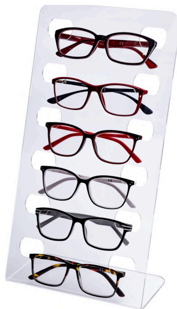
Ekspozytor na półkę/na ladę - pojemność 6 par okularów